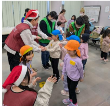
(12月 アイ・あいロビー)

子育て世代の親子や桃山学院大学の学生に「アイ・あいロビー」を知ってもらい、地域とのつながりを深め活性化を図るため、NPOやボランティアグループが協力して、楽しく遊んで交流できるイベントを企画しています。