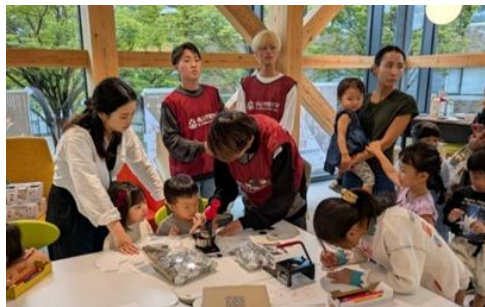
(10月 桃山学院大学エレノア館)