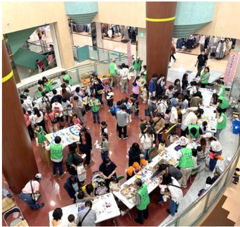
(6月 エコール・いずみ本館 2階)